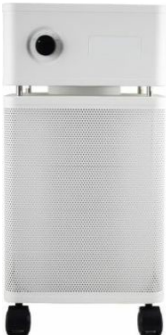
»"AirProtect" (Abbildung dient der Illustration)